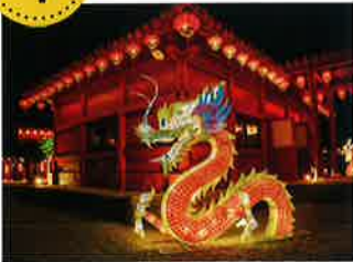
琉球ランタンフェスティバル