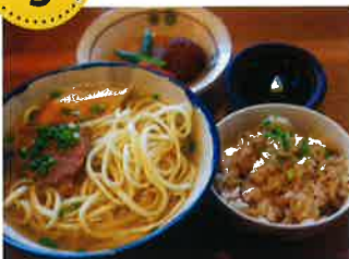
沖縄そばとジュース