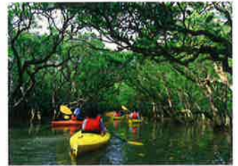
マングローブの森