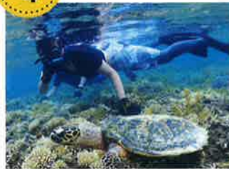
シュノーケリング