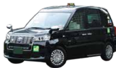
トヨタ自動車 JPN TAXI (ジャパntaxi)