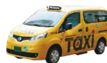
日産自動車 NV200タクシー